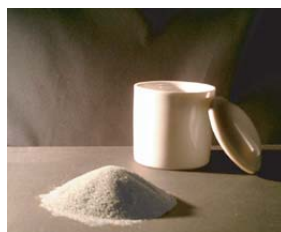
砂を代用したイメージ写真

遺骨を粉砕すると殆どが非常に細かいパウダー状になります。そのため直接振り撒こうとすれば一部が風にあおられて舞い上がったりすることがあります。また、容器も粉末が付着し処分に困ります。そのため粉末の遺骨は紙袋に納め紙袋ごと海に投下する方法が一般的です。ただ普通の紙袋だと投下後も水に溶けないため、長い間、遺骨は袋に閉じ込められたままとなります。水溶性の紙袋ならば、着水後、数秒で溶け出すため、遺骨はすみやかに水中に拡散していくことになります。